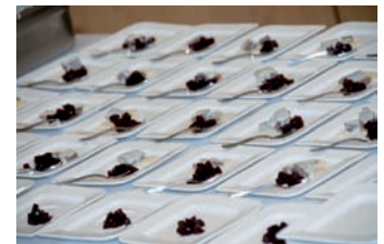
Kochshow im Konferenzraum 1